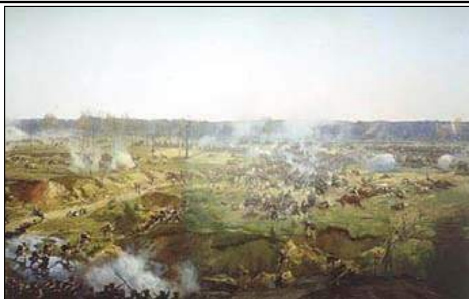
Ф.А. Рубо. Панорама «Бородинская битва»

С начала вторжения французской армии на территорию России в июне 1812 года, русские войска постоянно отступали. Быстрое продвижение французов лишало главнокомандующего русской армией, генерала Барклая-де-Толли, возможности подготовить войска к сражению. Затянувшееся отступление вызвало общественное недовольство, и поэтому император Александр I сместил Барклая-де-Толли и назначил главнокомандующим генерала Михаила Илларионовича Кутузова. Однако и новый главнокомандующий избрал путь отступления. Стратегия, выбранная Кутузовым, была основана с одной стороны на изнурении противника, с другой — на ожидании подкреплений, достаточных для решающего сражения с армией Наполеона. Первое крупное сражение произошло под Смоленском 4-6 августа 1812г. После тяжелых боев русские войска отступили. Самой большой битвой Отечественной войны 1812 года стало Бородинское сражение в районе села Бородина в 110 км к западу от Москвы. Сражению предшествовал кровопролитный бой за Шевардинский редут 24 августа. Бородинское сражение началось 26 августа (по новому стилю 7 сентября) 1812 года. Силы сторон были примерно равны. У русской армии было 132 тыс. человек и 640 орудий. У противника было 135 тыс. человек и 587 орудий. В 5:30 утра более 100 французских орудий начали артиллерийский обстрел. В критический момент сражения был совершен рейд конницы генералов-от-