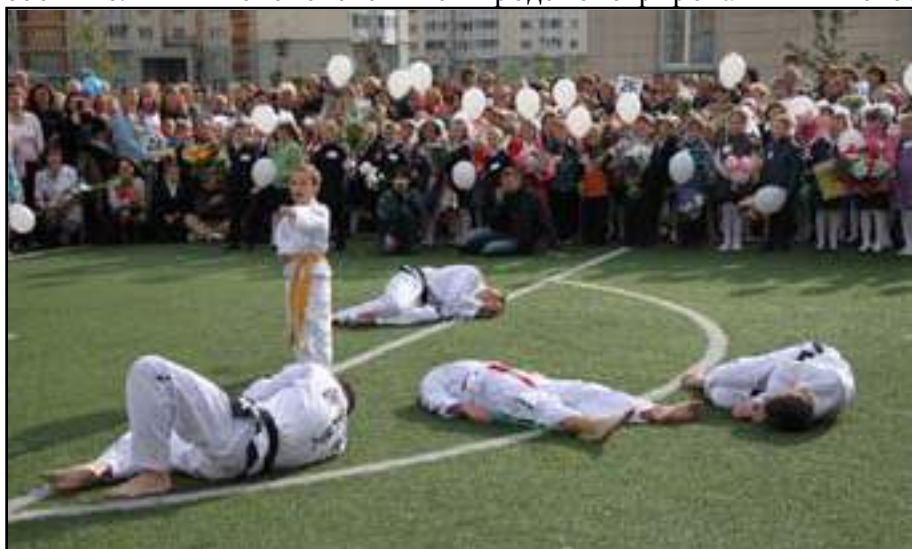
На фото: ученик школы таэквон-до наглядно демонстрирует свои умения, доказывая важность силы духа бойца

Редакция школьной газеты поздравляет всех учеников и учителей с началом нового года! Желаем всем огромных успехов, наилучшее выражение которых — в хороших и отличных отметках! А журналисты школьного издания, как и в прошлом году, будут стараться писать интересные и актуальные материалы для вас!